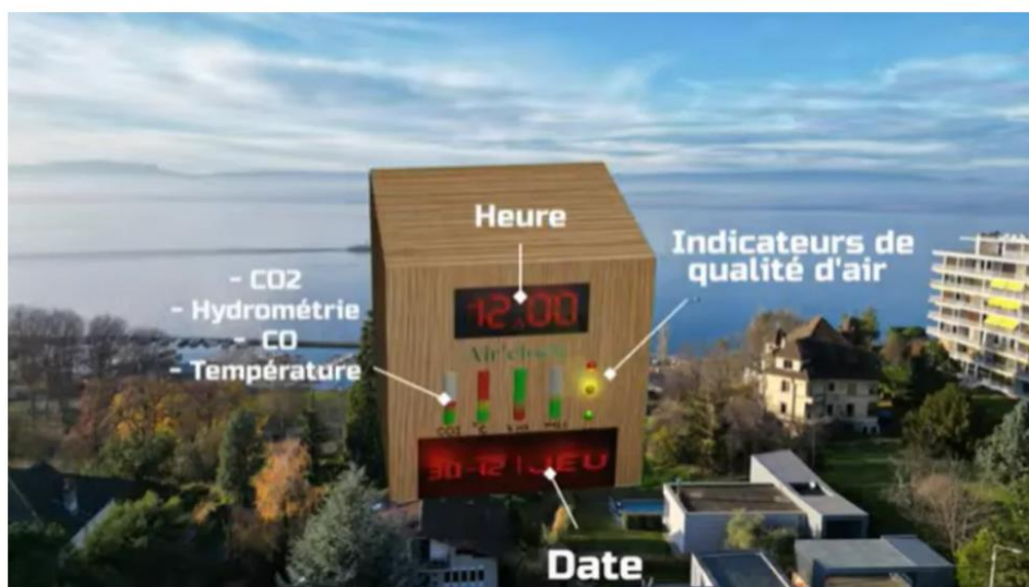
Thonon-les-Bains : Des lycéens primés pour une horloge intelligente